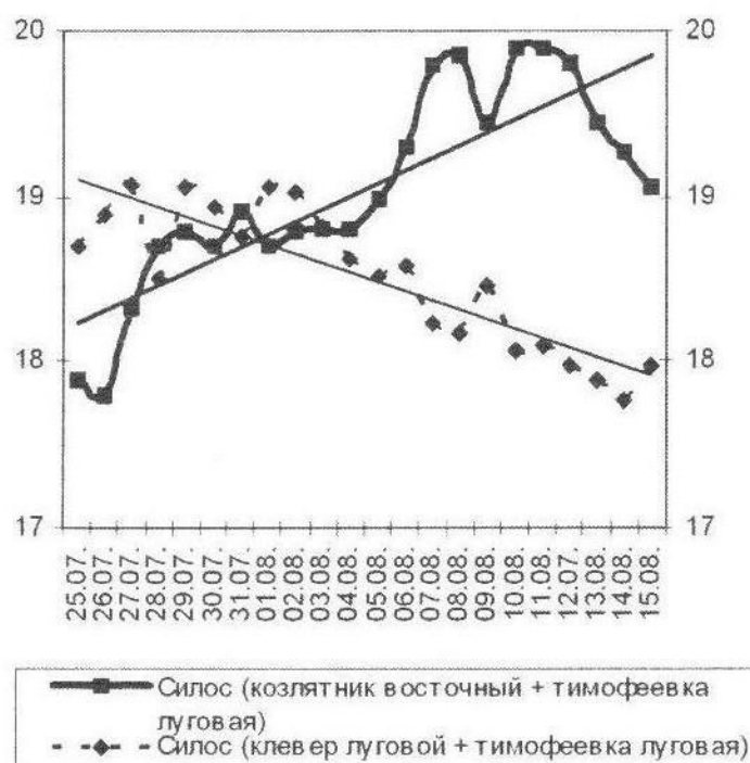
Рис. Динамика удоев КРС в зависимости состава силоса в условиях ЗАО «Гомонтово», кг/гол. (2002 г.).

Как показал производственный опыт внедрения козлятника восточного в Ленинградской области (ЗАО «Гомонтово»), увеличение в рационе животных доли кормов из этой культуры до 9% (в пересчете на к.е.) обеспечило рост годовых удоев на одну фуражную корову с 4000 до 6000 кг/гол. В 2002 г. в этом хозяйстве был проведен следующий производственный опыт. Две группы дойных коров (каждая численностью по 610 голов) получали по 30 кг силоса в день, приготовленного из разных видов бобово-злаковых травосмесей.