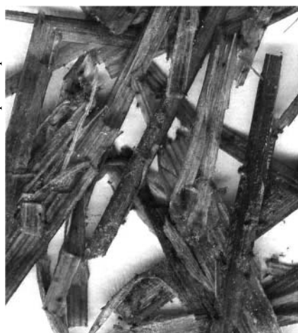
Рис. 1. Действие «Гумификатора» на соломе