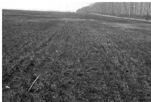
Рис. 4. Биотехнология (Ризобакт СП) выпадение озимой пшеницы 5% апрель, 2010 г., 500 га