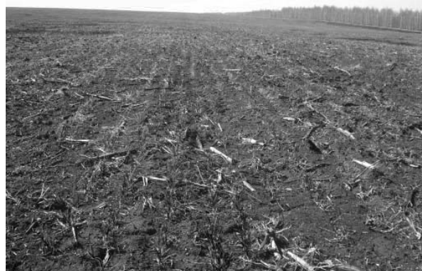
Рис. 3. Минеральные удобрения выпадение озимой пшеницы 90% апрель, 2010 г., 1000 га

Компания: ООО «Петербургские Биотехнологии», г. Санкт-Петербург, г. Пушкин, тел. / ф. (812) 327-47-84, моб. (921) 639-82-70, www.spb-bio.ru , эл. почта: info@spb-bio.ru